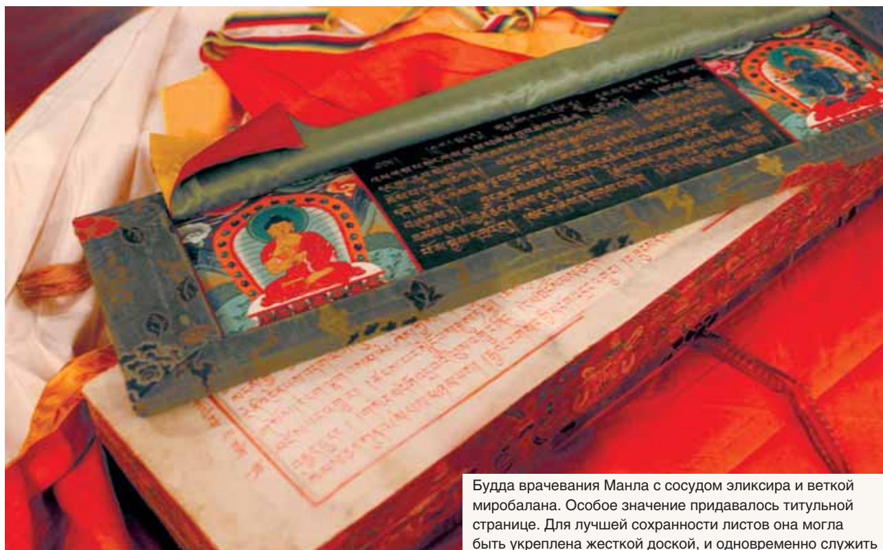
Будда врачевания Манла с сосудом эликсира и веткой миробалана. Особое значение придавалось титульной странице. Для лучшей сохранности листов она могла быть укреплена жесткой доской, и одновременно служить обложкой книги. По центру листа размещали название текста, а по бокам — изображения будд и божеств, имеющих отношение к содержанию текста