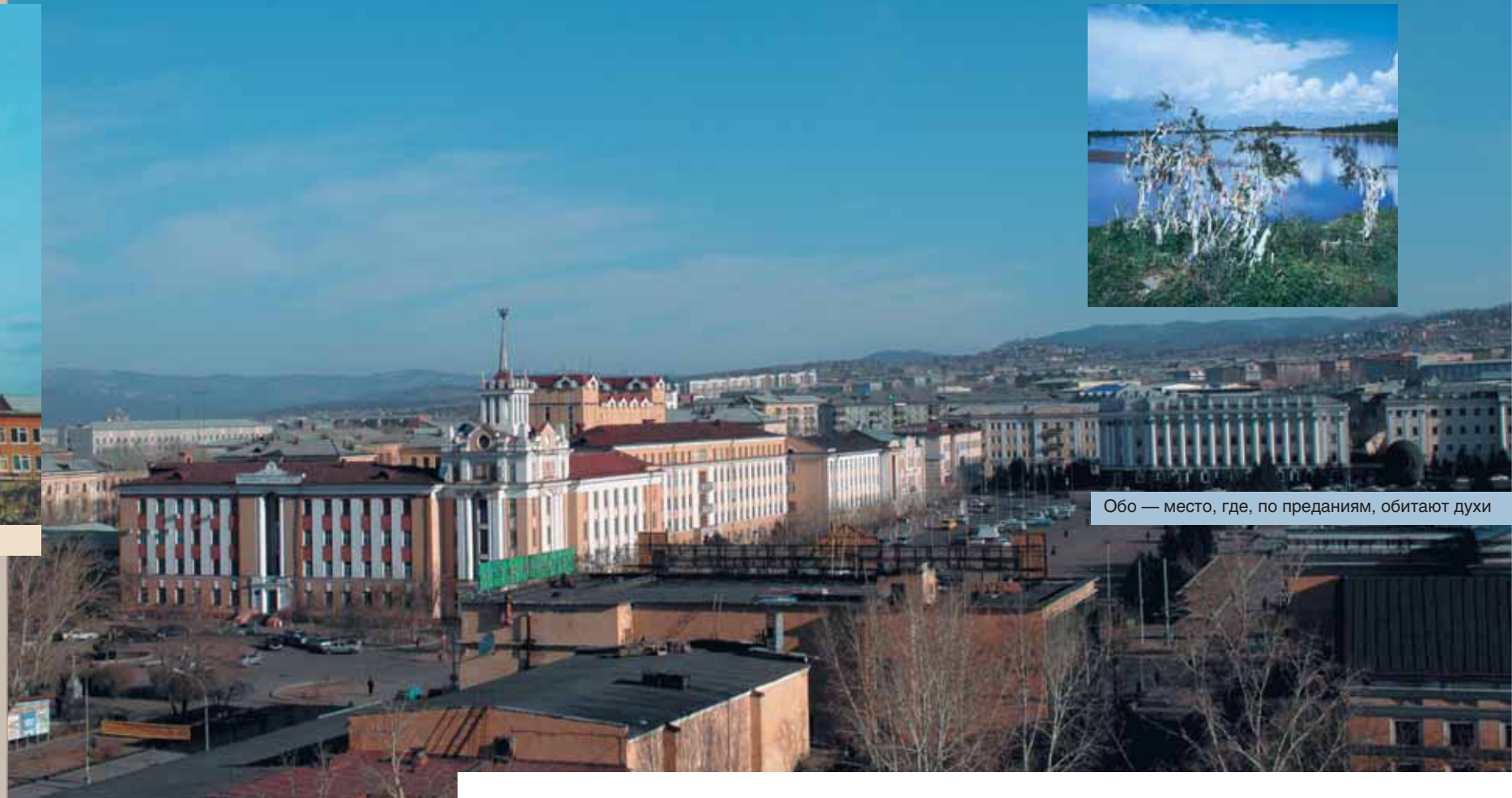
Обо — место, где, по преданиям, обитают духи