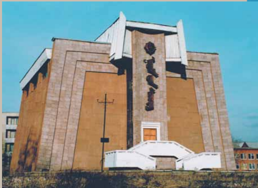
Здание хранилища восточных рукописей

Однако все это лишь отзвуки былого богатства бурятских храмов. По приблизительным подсчетам, в 1914 году минимальное количество буддийской литературы в сорока основных бурятских дацанах составляло 450 тыс. томов (по 400 страниц в среднем) и оценивалось в 4,5 млн руб. (в ценах 1914 года). Это без учета того, что в отдельных дацанах имелись особо ценные издания, художественно переписанные «девятью драгоценностями»*. К примеру, Ганджур (собрание проповедей Будды) без учета бумаги и драгоценных красок оценивался в 65 тыс. руб. в ценах 1909–1910 гг.**. Кроме того, в это число не было, очевидно, включено содержание десятков сотен субурганов (буддийских ступ, уничтоженных во времена репрессий), которые хранили сотни тысяч томов буддийских текстов и других культовых реликвий.