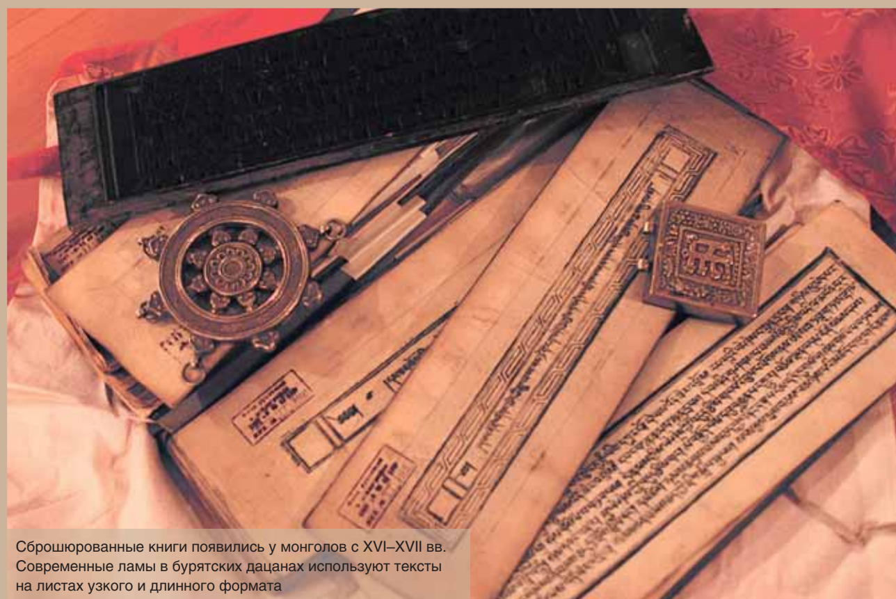
Сброшюрованные книги появились у монголов с XVI–XVII вв. Современные ламы в бурятских дацанах используют тексты на листах узкого и длинного формата