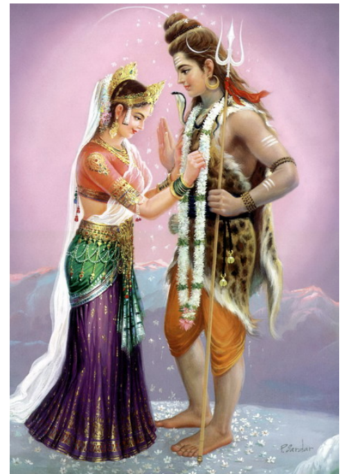
Шива и Шакти

В соответствии с индуистскими тантрами, Парабрахман или Абсолютная Реальность, становится источником творения, будучи разделенной надвое с целью самопознания. Этими двумя составляющими являются Шива и Шакти. Шива и Шакти в сущности не являются отделенными друг от друга, они, как бы, представляют собой два аспекта единой Абсолютной Реальности – Пурушу и Пракрити. В свете этого, Шива и Шакти предстают в качестве непроявленного (трансцендентного) и проявленного (имманентного) начал Высочайшего Абсолютного Единства, которые вносят свой вклад в дело проявления вселенной. С этого-то и начинается поляризация. На одном полюсе находится Единое Высочайшее Бытие, а с другой проявленный мир форм. В мужчине превалирует составляющая Шивы, тогда как сущность Шакти у него слабо проявлена. В женщине, напротив, превалирует сущность Шакти, тогда как составляющая Шивы проявлена слабо. Как следствие, мужчина стремится обладать женщиной, которая, в свою очередь, точно также желает мужчину.