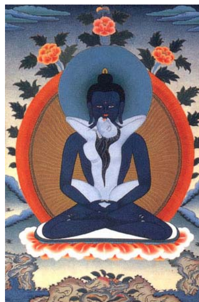
Праджна и Упая

Давайте проведем небольшое сравнение мировоззрений буддистов-сахаджиев и вайшnavов-сахаджиев. Как мы уже знаем, конечной целью буддистов-сахаджиев является достижение состояния высочайшего блаженства. Но это в корне отличается от высшей цели, которую преследовали ранние буддисты-тантрики, поскольку понимание Нирваны как Махасукхи, придает ей качества чего-то реально существующего, тогда как ранние буддисты были склонны стремиться к состоянию совершенного отрицания [растворения]. Махасукха для буддистов-сахаджиев выступала в роли окончательной стадии прозрения – состояния совершенного просветления. Состояние Махасукхи именовалось буддистами-сахаджиями термином “Сахаджа”, вайшnavа-сахаджии также его употребляли в отношении наивысшего состояния просветленного сознания. С той лишь разницей, что вайшnavа-сахаджии подразумевали под ним переживание состояния Высочайшей Божественной Любви. Гаудия