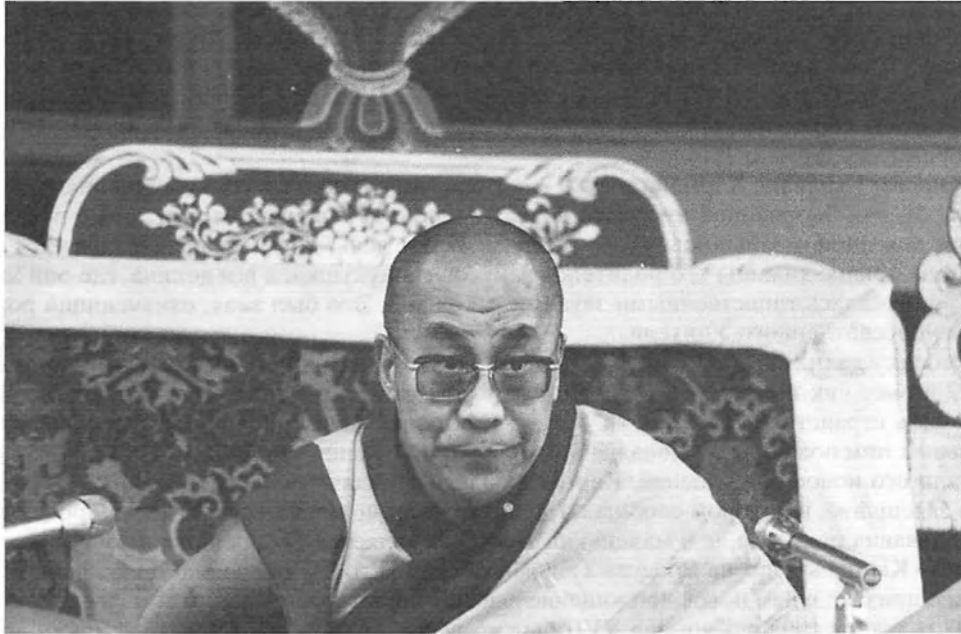
Далай-лама XIV. Фото автора, 2006 г.

Недавно россияне, постоянно живущие в Дхарамсале, рассказывали, как один иностранный журналист спросил Его Святейшество Далай-ламу XIV, если бы у него был выбор, президентом какой страны он хотел бы стать. Недолго думая он ответил: "России". Когда спросили – почему, Далай-лама сказал, что у России сейчас накоплен огромный духовный потенциал. В будущем все самое лучшее и передовое будет исходить именно оттуда. И люди там рождаются невероятно сильные.