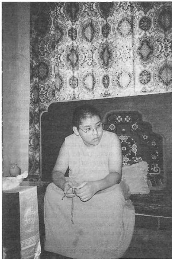
Линг Римпоче. 2006 г.

Линг Римпоче. Интересную историю о своем старшем наставнике Линге Римпоче поведал Далай-лама XIV. "Я всегда глубоко уважал Линга Римпоче, – пишет он, – хотя, когда был ребенком, боялся уже одного только появления его слуги, а всякий раз, когда слышал его знакомые шаги, у меня замирало сердце. Но со временем я стал ценить его как одного из наибольших и ближайших друзей. Когда Линг Римпоче умер, я почувствовал, что без него мне будет трудно жить. Он был той каменной стеной, на которую я мог опереться" ( Далай-лама 1992: 217 ).